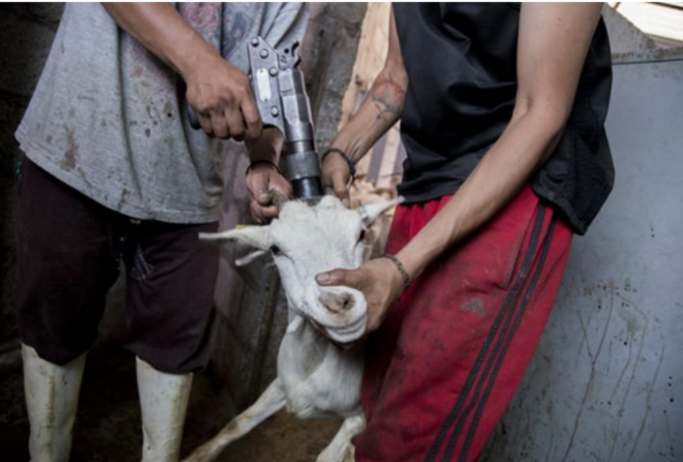
Unha cabra é aturdida cunha pistola de bala cautiva

Estas granxas son tamén empresas que buscan maximizar os seus beneficios. A súa fin é ofrecer ao consumidor produtos máis sáns, ecolóxicos ou de maior calidade e os animais seguen a ser considerados medios para isto. A súa preocupación polo benestar animal responde á fin de obter unha maior calidade de carne, dos ovos ou do leite, mais para os animais estas diferencias non significan nada. Animais que poderían alcanzar os quince ou os vinte anos de vida en condicións naturais son enviados ao matadeiro ás semanas ou meses de nacer nunha longa viaxe onde son privados de auga e alimento (algúns non o soportan e morren), reducindo drásticamente a súa esperanza de vida.