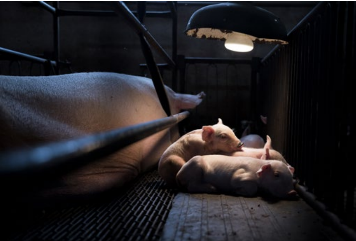
Porcos nunha xaula de maternidade

Estas vivencias, que me fixeron testigo de parte dos innumerables abusos, agresións e inxustizas que se cometen contra os animais, foron o xerme do proxecto Tras los Muros 1 . Baixo este nome publico un traballo de documentación e investigación acerca da opresión que padecen os animais non humanos nos diferentes ámbitos de explotación e tamén sobre a loita pola súa liberación. É o caso deste recorrido visual. Os protagonistas das seguintes imaxes son os habitantes refuxiados do santuario 2 Wings of Heart , un lugar xestionado por activistas onde viven animais rescatados da industria gandeira nun entorno de respecto e equidade.