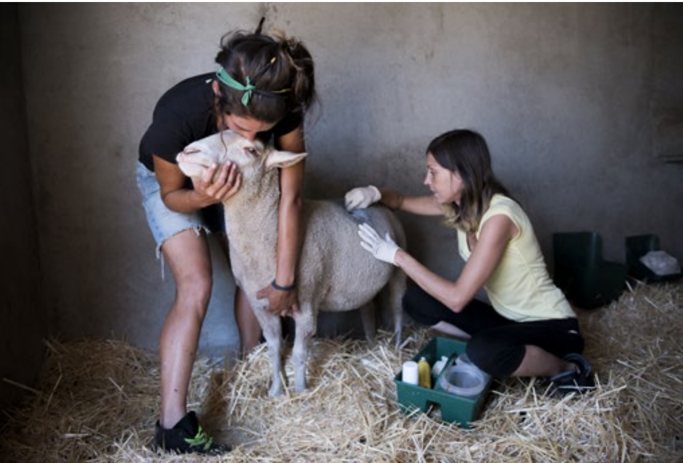
Sonia e Laura na sesión de curas de Maru

Os animais que confinamos nos centros de explotación posúen individualidades que os fan únicos. Porén, a industria numéaos e négalles ese recoñecemento convertíndoos en propiedades mercantís e impedindo calquera acercamento ás súas vidas. O nome propio descosifica aos animais, visibiliza a súa personalidade e fainos únicos e importantes. Por esta razón no santuario Wings of Heart cada animal é chamado polo seu nome. E así, cando unha entende que esa vaca non é só unha vaca, senón Carmen; que ese cabrito non é só un cabrito, senón Alfonso; ou que ese porco non é só un porco, senón Bakunin; permite que o mundo emocional dese animais se acerque ao seu,