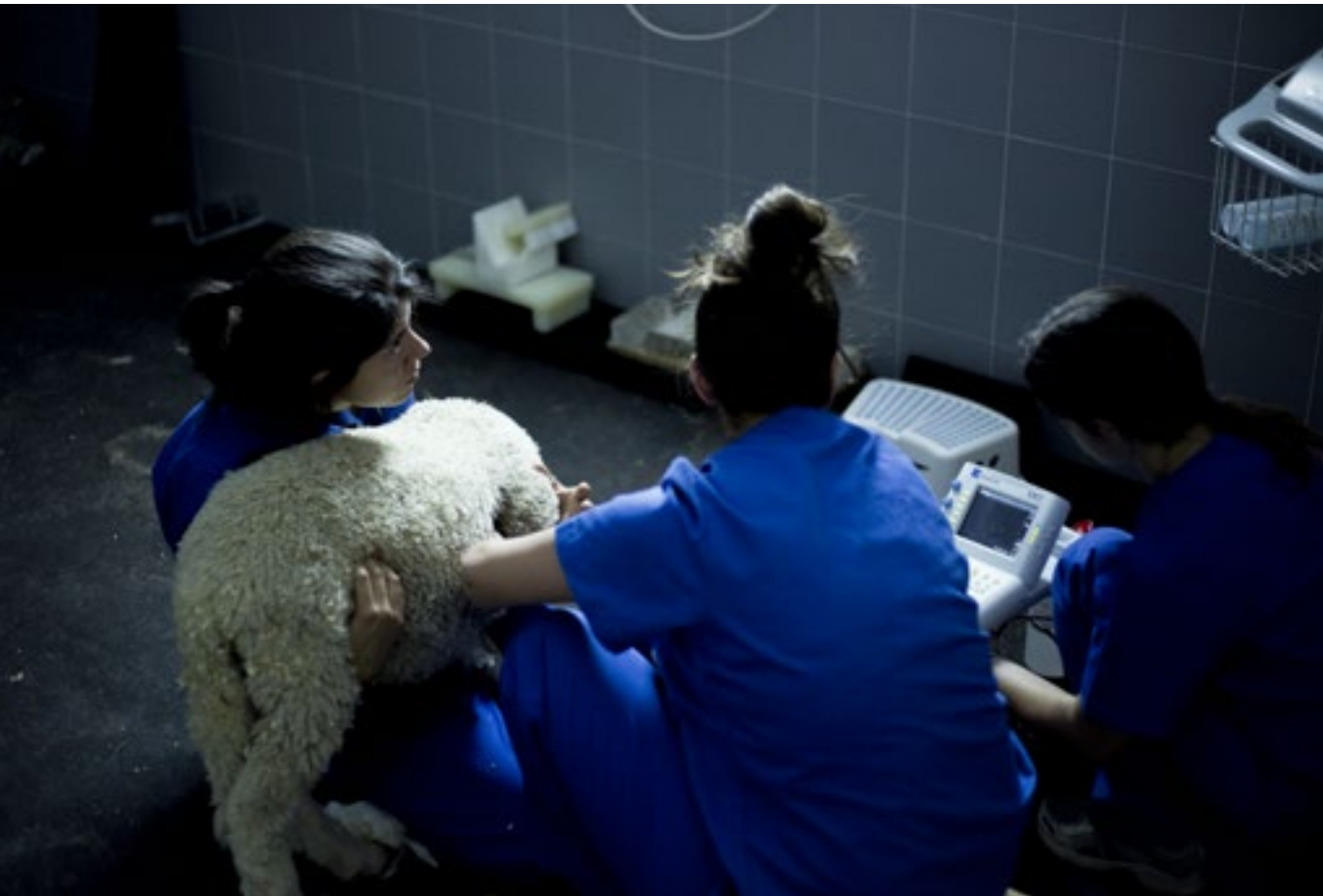
Sergio no Hospital Veterinario da UAX atendido por un equipo veterinario