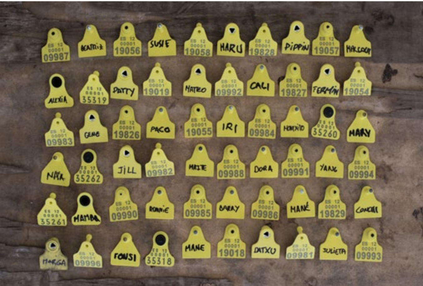
Crotais que pertencen aos habitantes do santuario