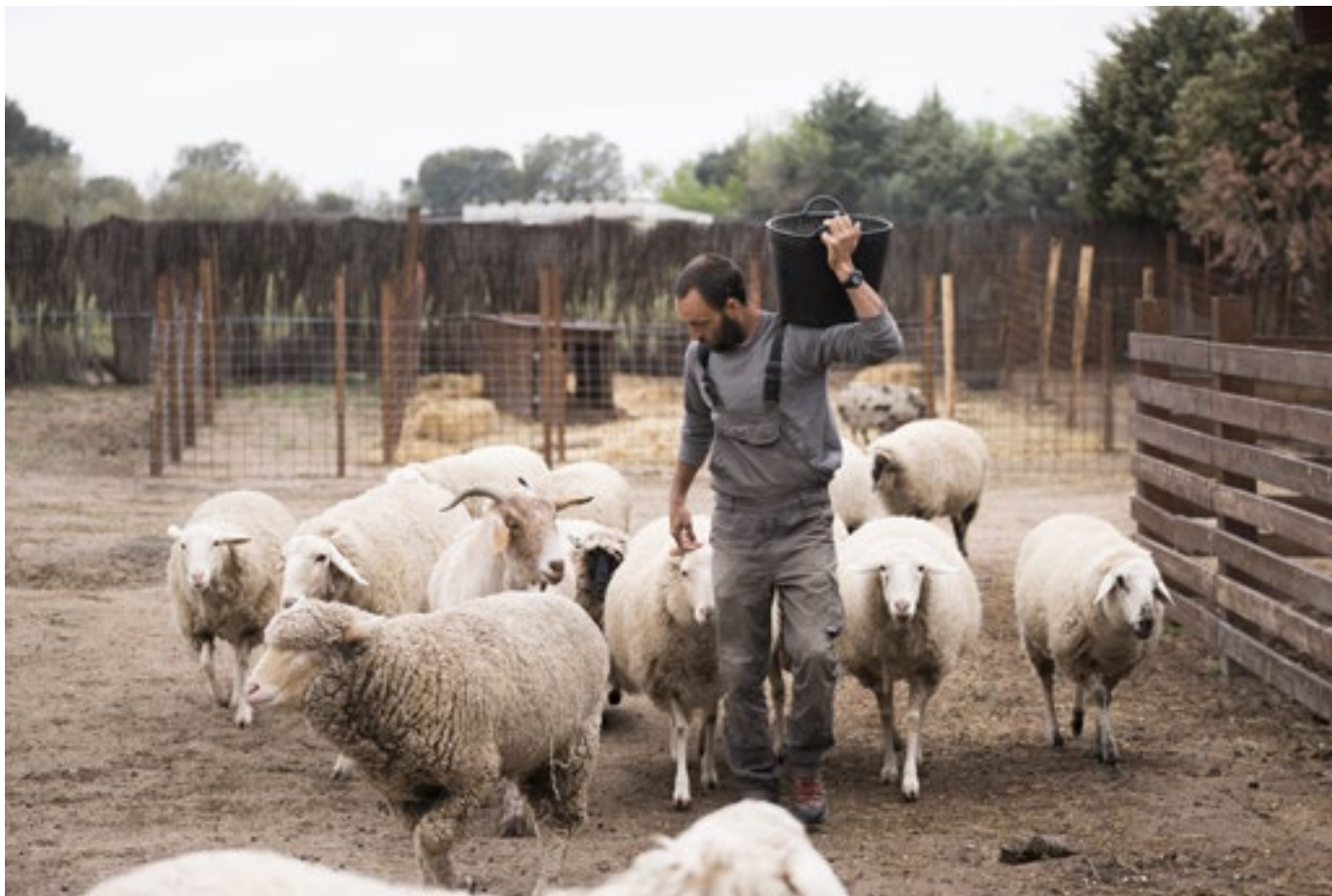
Edu dispónse a repartir a cea entre o grupo de cabras e ovellas refuxiadas (Mane, Conchi, Jill, Montxito, Pippin, Paco, Susie, Iri, Gene...)

Cada día dende fai xa seis anos madrugan para atender as necesidades dos máis de trescentos animais que viven refuxiados neste lugar: ovellas, vacas, porcos, patos, gansos, galiñas, cabras, burros e cabalos que foron rescatados de unha situación de explotación programada. A nova vida que lles espera a todos eles é diametralmente oposta á que sufrían na granxa. Mentres alí eran tratados como medios de produción, no santuario son as súas necesidades as que marcan a axenda e o ritmo de traballo.