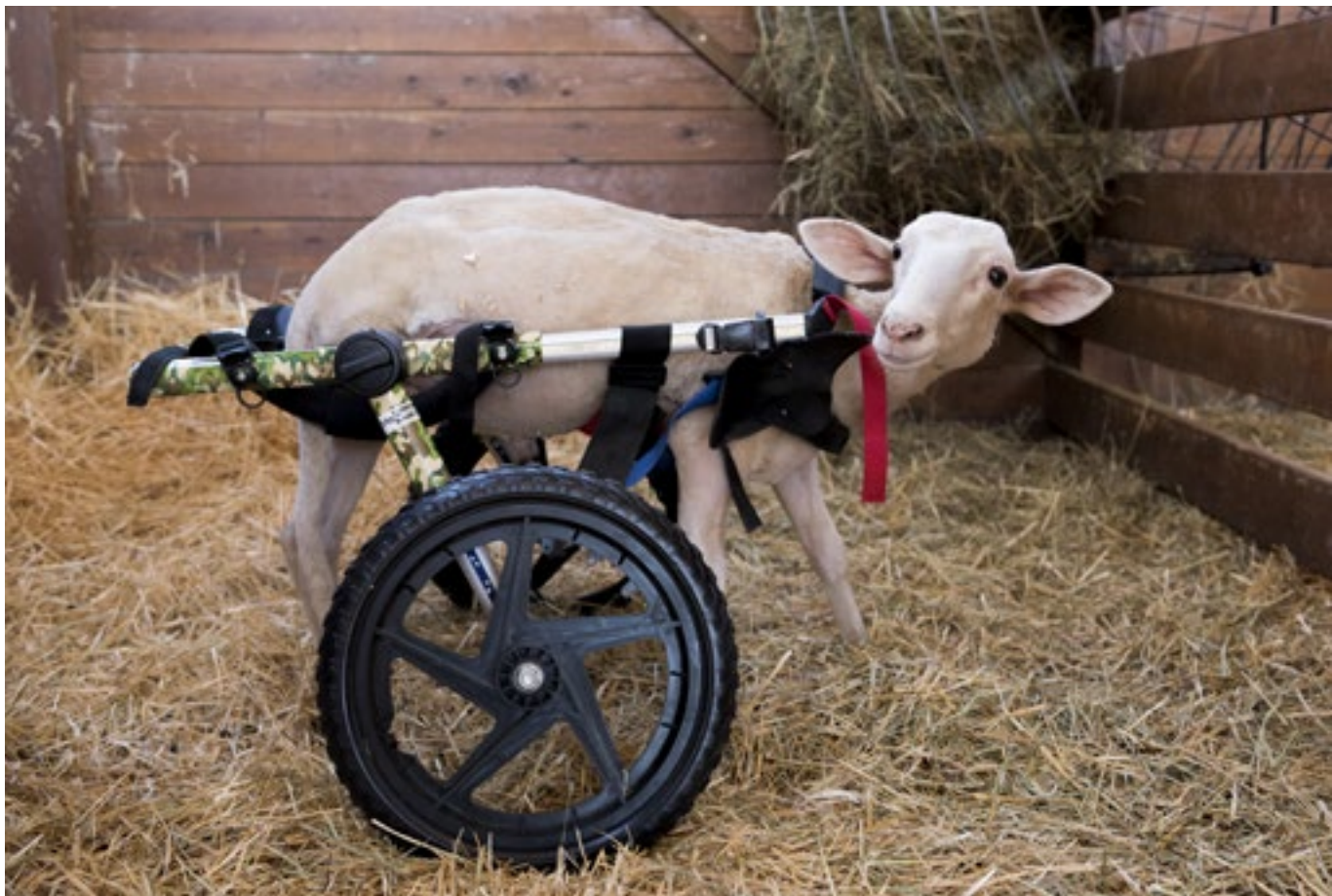
Pablito, un cordeiro refuxiado na súa cadeira de rodas. A súa pata traseira foi amputada debido a unha infección orixinada na granxa onde foi explotado

ilexítima froito dunha situación de desigualdade, faise necesario renunciar a eles e transformalos en ferramentas de cambio para quen son hoxe oprimidos.